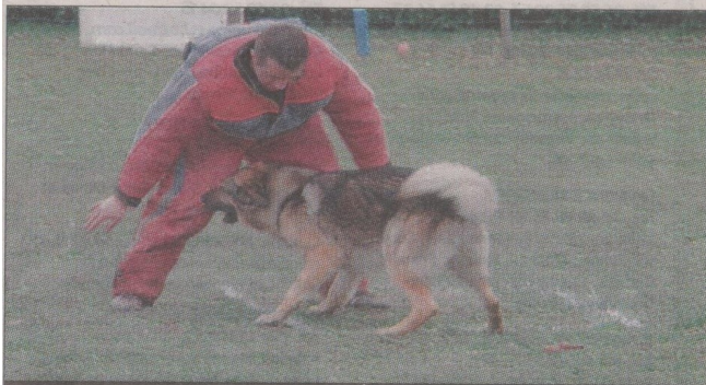
L'ATTAQUE. Falco défend son maître.

Le week-end s'est conclu autour du pot de l'amitié et le président Jean-Michel Chauveau a remercié la municipalité pour son aide et le prêt du terrain, chemin de Souchènes. ■