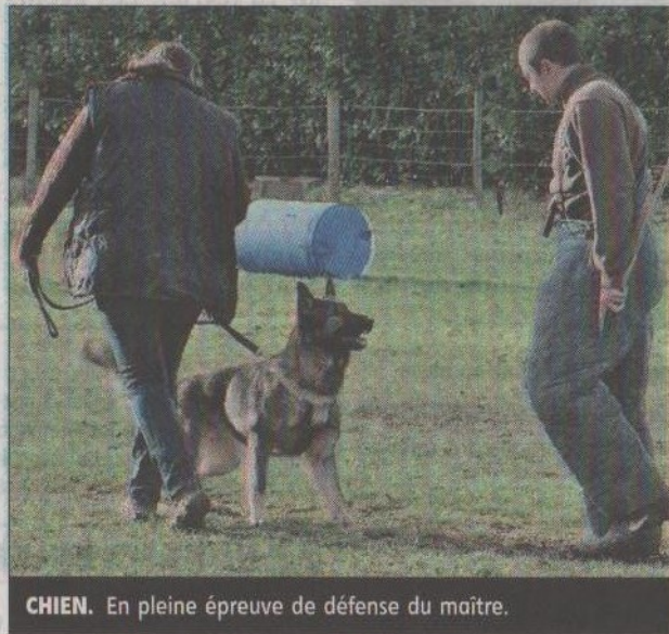
CHIEN. En pleine épreuve de défense du maître.

Une vingtaine d'équipes venues de la Région mais aussi du Nord, de Dordogne, de Normandie se sont ainsi entraînées au dressa-