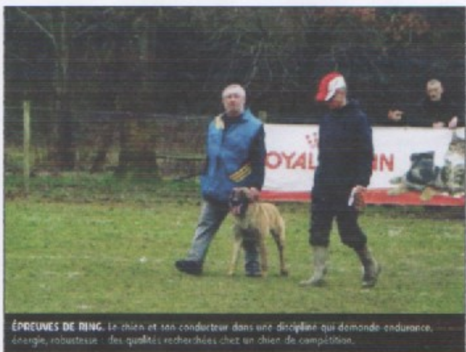
ÉPREUVES DE RING. Le chien et son conducteur dans une discipline qui demande endurance, énergie, robustesse : des qualités recherchées chez un chien de compétition.

« Le ring est une discipline très exigeante. Cette pratique sportive permet de mettre en exergue toutes les qualités du chien,