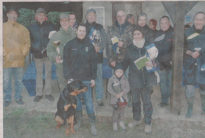
RÉCOMPENSES. Remise des coupes aux maîtres dont les bêtes ont subi avec succès les épreuves des échelons 1 et 2 à l'issue de la première journée.